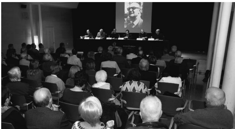
Entrega del II Premi Martí Pous i Serra. Autor: Xavier de la Cruz