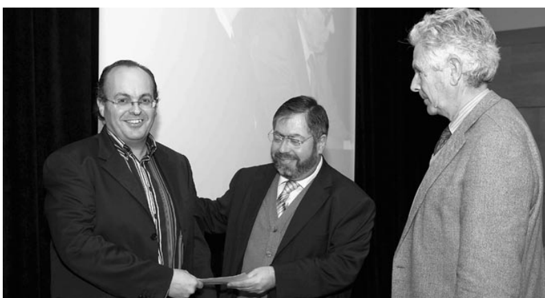
Entrega del II Premi Martí Pous i Serra.

L'autor es va centrar més en el cas barceloní del Patronato de las Viviendas del Congreso Eucarístico, atesa la seva vinculació sentimental a un dels barris creats per aquesta entitat a Barcelona, el barri del Congrés de Barcelona. Una vinculació que anava reforçada per la seva trajectòria com a historiador local a Barcelona. En concret, havia publicat amb col·laboració altres monografies sobre els barris de la Sagrera, Sant Andreu de Palomar, el Bon Pastor i sobre aspectes relacionats amb el patrimoni industrial de Barcelona, i va ser coordinador de Barcelona, ciutat de fàbriques i Poblenou, la fàbrica de Barcelona .